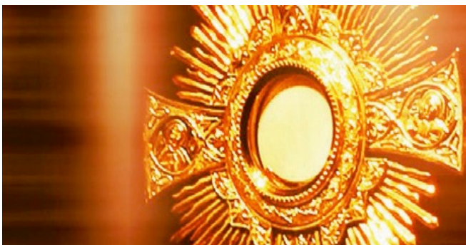
Le 2 mars, Louange/Adoration.