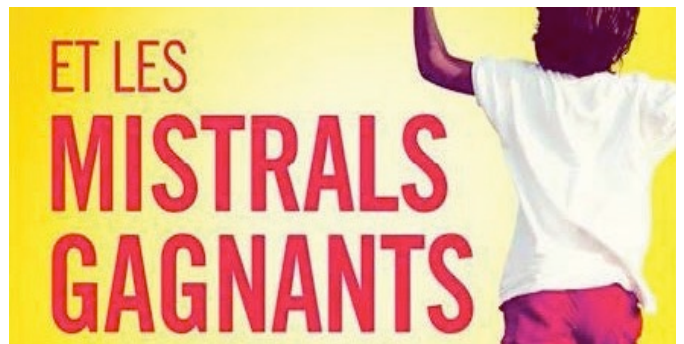
Le 9 mars, film « Et les mistrals gagnants ».