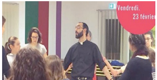
Le 23 février, danses d'Israël.