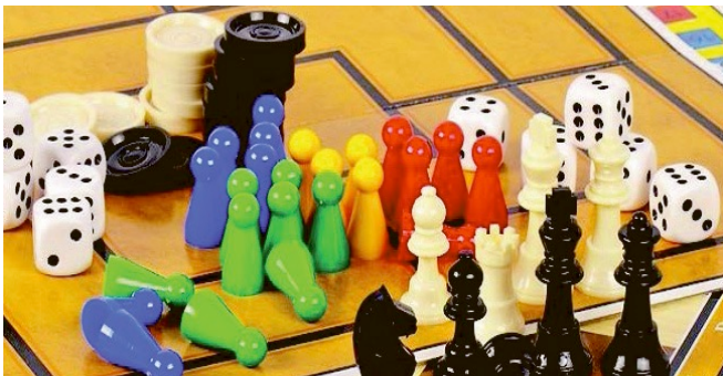
Le 16 février, jeux de société.

19h00 : prière des vêpres - 19h30 : soupe 20h30 à 22h : soirée paroissiale :